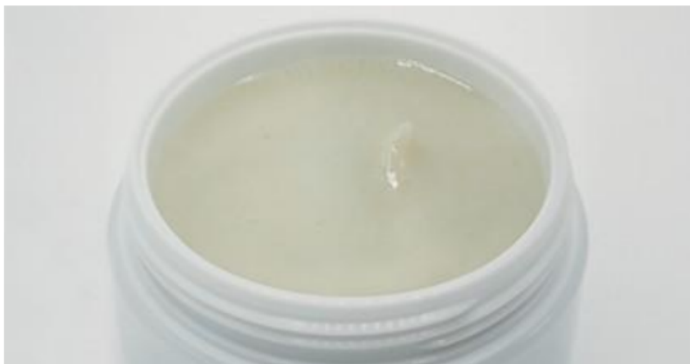
OVEIL BRI 10wt% 凝胶