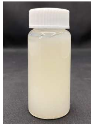
分散液作製後1ヶ月